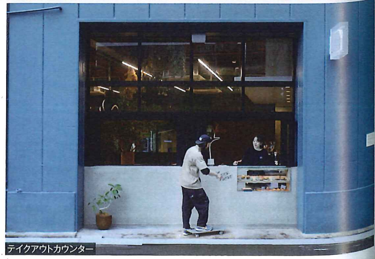
テイクアウトカウンター

ライフスタイルの変化や、価値観の多様化などにも起因し増加する空室や空きビル、遊休空間に対して新たな活用を提案する新プロジェクトとして複合施設「N6」をオープンしました。 N6 の中では「ベーカリー&カフェ」「セレクトストア」「ギャラリー」からなるKNOT MARKET PLACEを展開。人と人、人と街、人とコトをつなぐ拠点をつくることで、街を活性化させ、新しいカルチャーが生まれる余白をつくり、施設を通してエリア全体の魅力を高めることに挑戦していきたいと思っています。 株式会社ノットコーポレーション